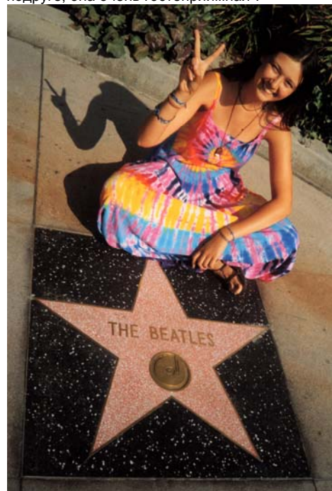
Так началась череда самых ярких моих приключений.

И вот когда я думала уже, не заночевать ли в этом милом сквере, сэкономяв не только силы на дорогу в хостелс, но и 15$, рядом остановилась забавная желтая двухместная машинка. "Ты, наверное, идешь в хостелс?" — догадался ее владетель. — Давай я тебя подвезу. Или, если хочешь, могу отвезти к моей хорошей подруге, она очень гостеприимная".